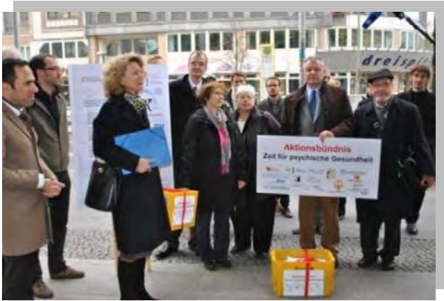
Das Aktionsbündnis Zeit für seelische Gesundheit hat vor dem Bundesgesundheitsministerium gegen die geplante Ersatzvornahme protestiert

Auch der Bundesverband der Angehörigen psychisch Kranker e.V. trägt das Anliegen mit, Krankenhausbehandlung möglichst effizient zu organisieren. Ziel des KHRG muss es aus unserer Sicht ebenso sein, die Rahmenbedingungen für die stationäre Versorgung psychisch kranker Menschen zu sichern bzw. zu verbessern sowie sektorenübergreifende Ansätze zu stärken. Unter-, Über- und Fehlversorgung in der Therapie und Rehabilitation psychisch kranker Menschen erleben die Patienten und ihre Familien zuerst und ganz unmittelbar „am eigenen Leib“ – und eben auch an der eigenen Seele.